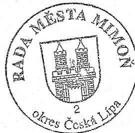
František Kaiser starosta města

Rada města Mimoň schvaluje výzvu k zakázce - podání nabídky na akci „oprava balkonů v domě U Nemocnice 543-544 Mimoň“, která je přílohou tohoto usnesení. Rada města Mimoň schvaluje seznam oslovených uchazečů, který je přílohou tohoto usnesení.